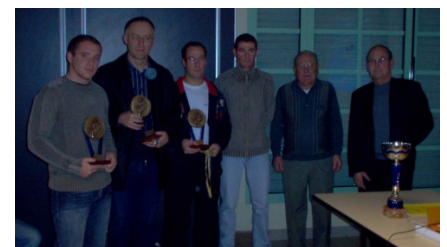
Remise des récompenses 2007.