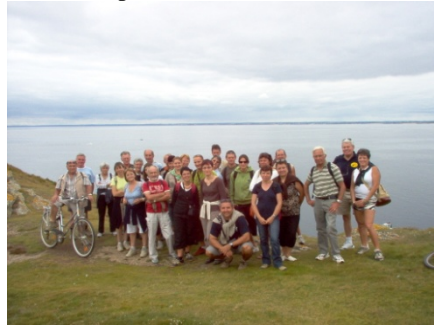
Le groupe réuni devant l'immensité de l'Atlantique.