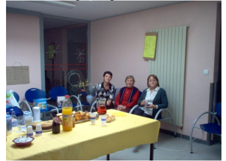
Les serveuses en pleine action....