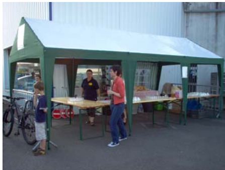
Le bar de l'UCPR.