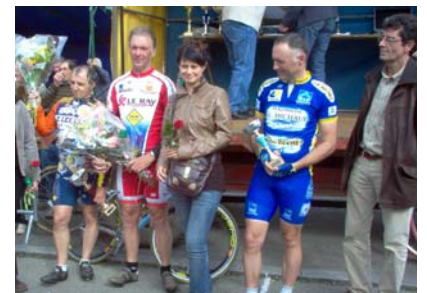
Le podium d'arrivée du Gâvre.