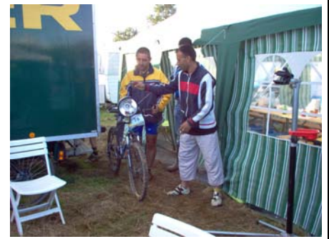
Préparatifs pour la nuit.