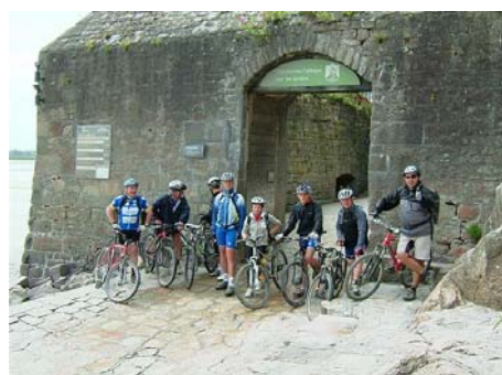
Devant le Mont Saint Michel.