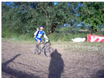
Ils n'ont pas tous souffert.....