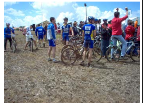
Les équipiers en attente du relais.