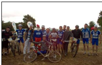
Les équipes avant le départ.

- Les 24 Heures Malviennes : J'étais au départ de cette « épreuve » et je pèse mes mots car il s'agissait bien d'une épreuve. Samedi 16 juin à 14h00 était donné le départ des 24 heures VTT de Mauves. Sous une pluie battante nos guerriers s'élançaient pour « 2 tours d'horloge ». Les conditions étaient innombrables et je tire mon chapeau à nos 3 équipes qui représentaient le club de belle façon. Toutes mes félicitations aux participants et à l'intendance qui n'avait pas lésinée sur les moyens.