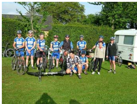
L'équipe au complet.