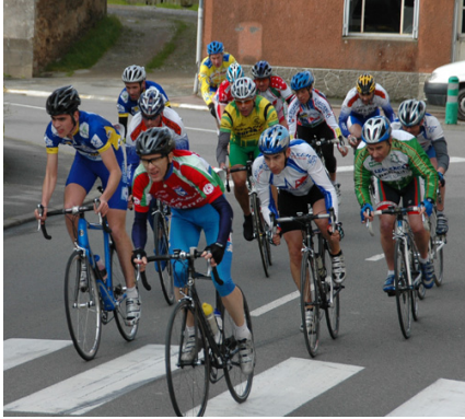
Une vue du peloton.