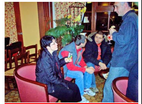
Verre de l'amitié à l'Hôtel CAMPANILE