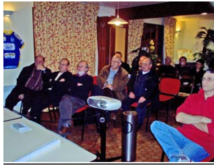
L'assistance très attentive!

Images de la présentation de la randonnée à l'hôtel Campanile de REZE.