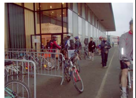
Le garage à vélos :