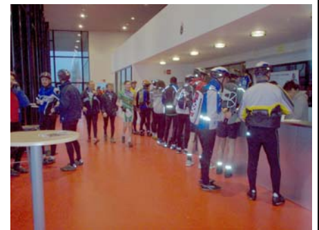
La restauration :