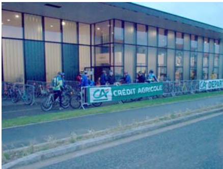
La façade du gymnase, zone de départ