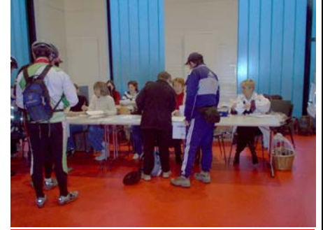
Inscriptions et le Départ du gymnase Arthur Dugast à Ragon :