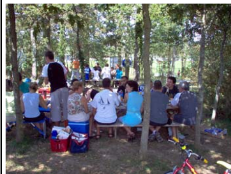
Vu du pique nique sous les arbres!