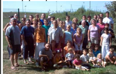
Une vue d'ensemble des participants!