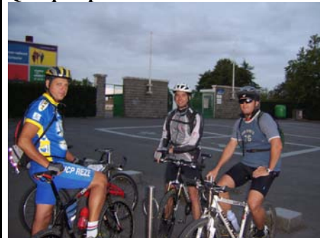
Reconnaissance de REZE-PORNIC