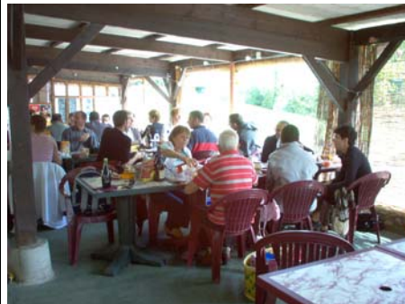
Le pique nique à Pont Caffino