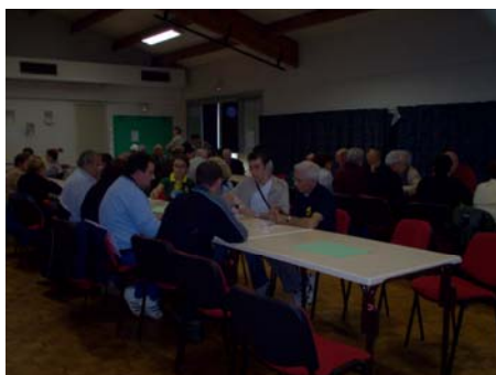
Les 22 équipes en pleine concentration.