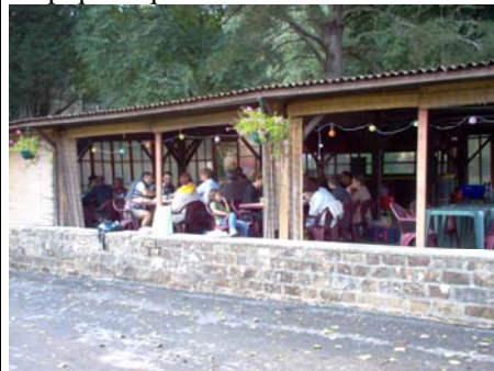
Les mêmes de l'extérieur,