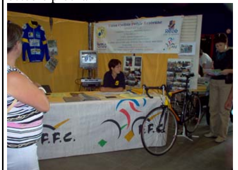
Vu du stand UCPR, 2006

Il reste maintenant à gérer tout cela, mais nous comptons sur nos éducateurs (7 au total) puisqu'un nouvel arrivant au 10 septembre, en section "Pass-cyclisme", est titulaire d'un BF1. (José KERBIRIOU, nous vient du comité de Bretagne). Ils tiendront leur première réunion officielle le 23 octobre prochain.