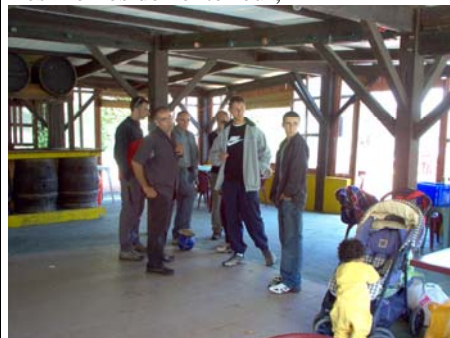
A l'heure de l'apéro!!!