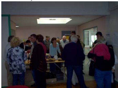
La pause café.....