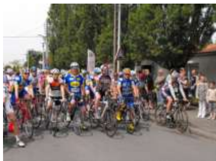
Départ du GP Garages BECHET.

L'an dernier nous célébrions notre cinquantenaire à la même date.