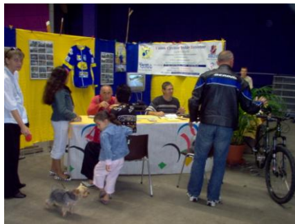
Le stand de l'UCPR en plein boom.

Je tiens à remercier les membres du club présents à cette occasion, pour leur concours et la participation au montage et démontage du stand de l'UCPR au forum 2008 qui se déroulait ce samedi 13 septembre.