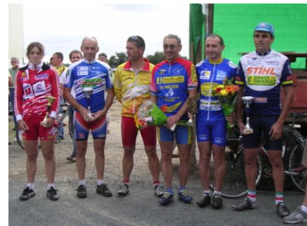
Le podium d'arrivée.