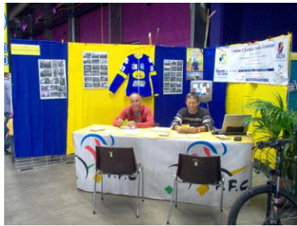
Les forces vives prêtes à l'action.