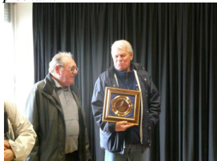
Les anciens récompensés lors du cinquantenaire.

Rendez-vous à l'Assemblée Générale du club le vendredi 14 novembre prochain.